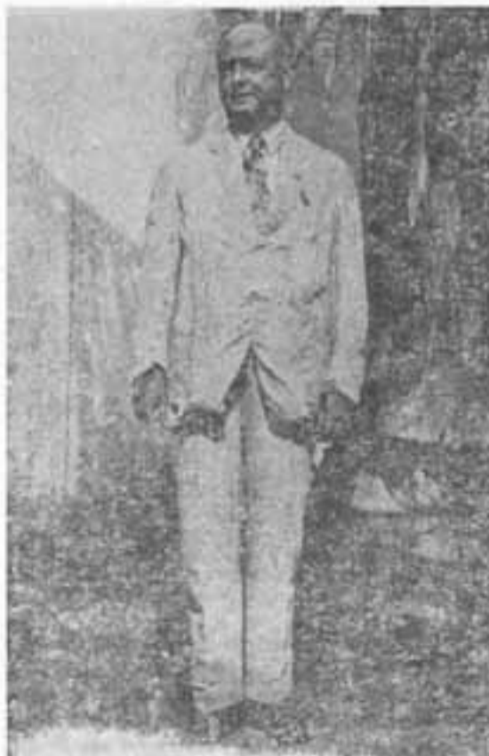
GENERAL JOSE MARIA MONCADA