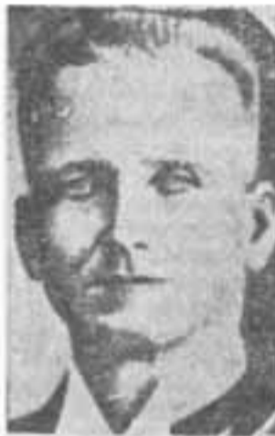
Ex Pdte. Solórzano

Intervine entonces para manifestarle: Puedo ir a León hoy mismo y traerlos carta de Godoy, que es gran amigo mío y él