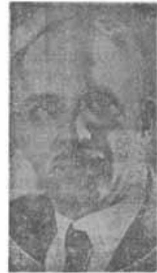
DR. JUAN BAUTISTA SACASA