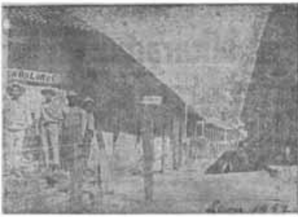
Retén Conservador que se mantuvo en pleno centro comercial de León con mampostería de alambradas de púas.