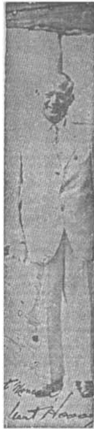
GRAL. Y EX-PDTE. JOSE M. MONCADA

brememente en Managua y alquilaba el zaguán de la casa solariega de la familia del ex-Pdte. Gral. Zelaya, situada frente a La Sarrasena. Esa era la residencia de la Legación de los Estados Unidos, gobierno éste que no reconocía al régimen de facto del Gral. Emiliano Chamorro, y por el contrario lo presionaba a dejar el mando en manos de don Adolfo Díaz, persona grata a la política estadounidense, contraria entonces a los Golpes de Estado en Centro América por haber suscrito convenios en Washington, en 1923, para contrarrestarlos.