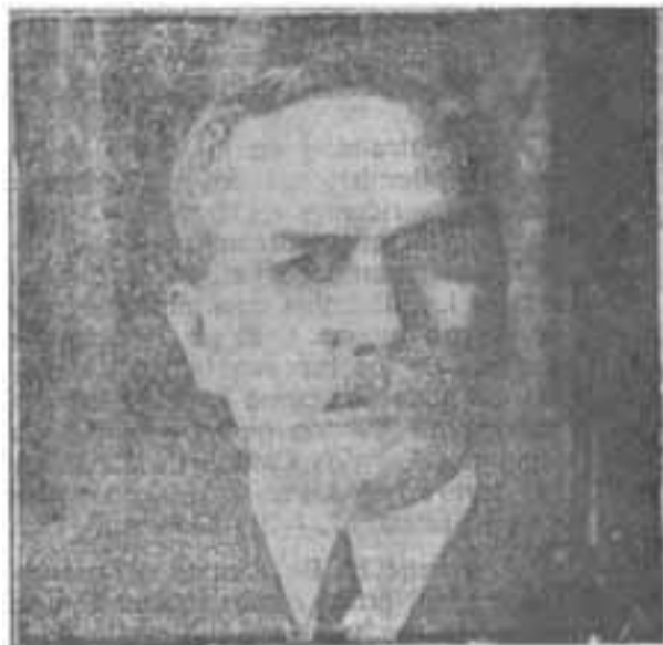
EX-PRESIDENTE DON ADOLFO DIAZ