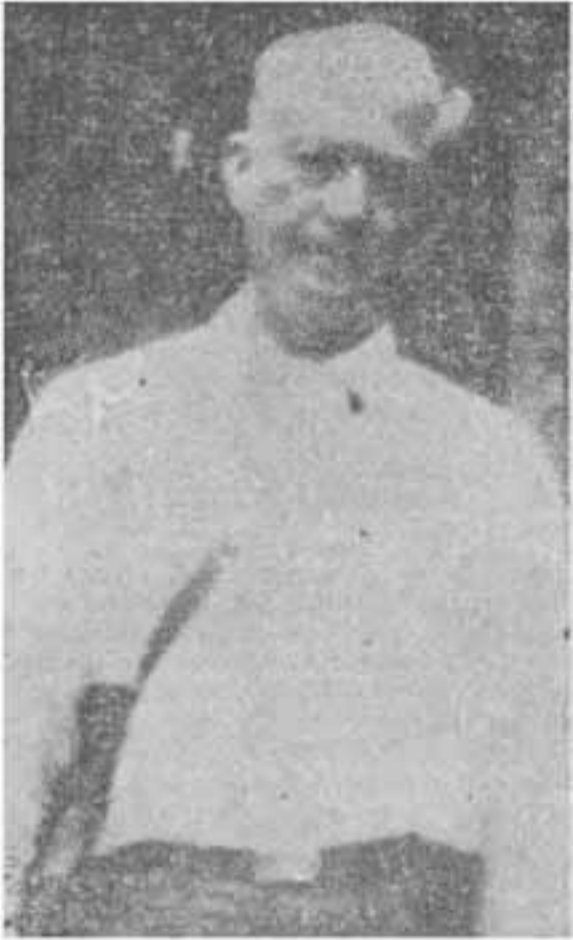
GRAL. JOSE MARIA MONCADA