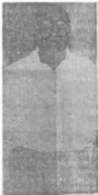
GRAL. FRANCISCO PARAJÓN, CABALLERO DE LA GUERRA

En efecto, el 16 ocupé El Sauce. Mi propósito era envolver al enemigo en el Pílon o en San Francisco; desplegando sobre él un movimiento envolvente y calculado. El enemigo creía darme la batalla definitiva en El Sauce. Mientras yo pensaba lo contrario: que la batalla debiera ser donde el enemigo no tuviera conocimiento del terreno, cosa favorable para nosotros. Pero, por