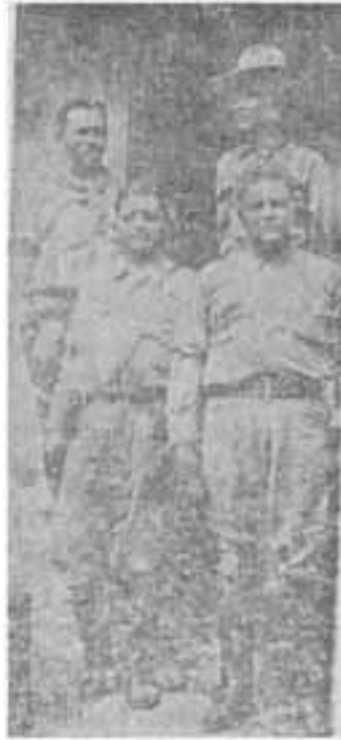
PARAJON Y EL DR. Y GRAL. CERDA

El 7 llegaron los aeroplanos con bandera roja, y momentos después un señor se acercó a decirme que en el frente de Filadelfia se notaba inusitado movimiento del enemigo. Y más o menos a las once y media dió comienzo el ataque, con toda rudeza.