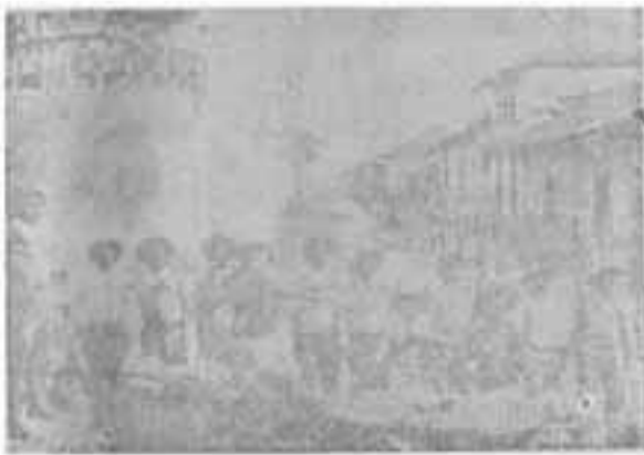
Otro Retén de fuerte grupo de soldados conservadores, usó alambradas y trincheras de sacos de arena en el derruido Parque Infantil, calle de la Catedral al Panteón de Guadalupe.

En dicho convenio se estipulaba entre dos cláusulas: el nombramiento de autoridades liberales en los lugares que a juicio de los suscriptores fuese liberal, y es una razón histórica y muy sabia por aquellas personas amantes de la historia de nuestra patria, que en las elecciones presidenciales realizadas en el año de 1928, reglamentadas y legalizadas por las fuerzas americanas de ocupación, cuando los encargados del recuento electoral de dicho movimiento cívico vieron que la fórmula del señor Adolfo Benard estaba a la cabeza del recuento, hasta que los departamentos de León y Chinandega fueron computados, la fuerza liberal de estos departamentos inclino la balanza determinadamente hacia el triunfo inequívoco de la fórmula Constitucional del General José María Moncada, como Presidente de la República y del doctor Enoc Aguado Farfán, como vice-Presidente.