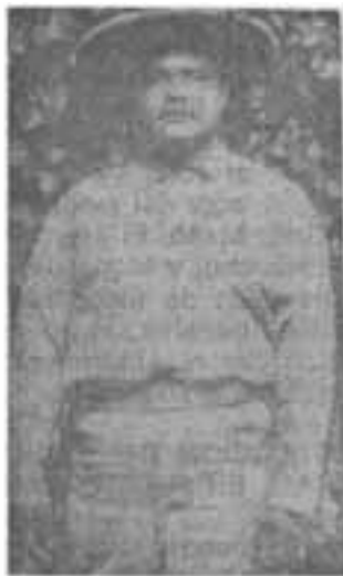
GRAL. PARAJON EN TRAJE DE CAMPAÑA

rias del Gobierno conservador chamorrista en su periódico, dieron origen a que el liberalismo de occidente se rebelara contra la usurpación, sólo con la fuerza de la dignidad y del corazón, arrebatando las armas al ejército de Emiliano Chamorro que se creía invencible con el insulto.