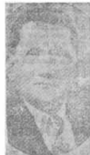
GRAL. ALFREDO NOGUERA

botín recogido por nosotros fue de tres ametralladoras capturadas y (tres que abandonó el enemigo en huida) 75.000 tiros, y casi 300 rifles, más comestibles, harina, calzado y dinero en cantidad de tres mil pesos más o menos. ¡Ya aquella sí que era Revolución! El general Noguera Gómez, acababa de ser muy útil a la causa de la Patria y el Partido Liberal. Nunca es tarde, y ahora aprovecho la oportunidad de rendirle las gracias al general Noguera Gómez, por el gran servicio que nos hizo al dejarnos toda aquello.