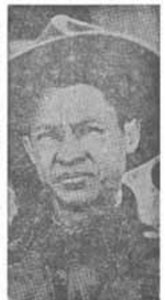
GRAL. AUGUSTO C. SANDINO