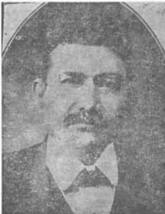
GENERAL LUIS MENA VADO

Hecho ese reconocimiento frente a una persona joven que no conocía personalmente al Gral. Moncada, le entregó para éste una carta de presentación para el General José María Moncada, que vivía po