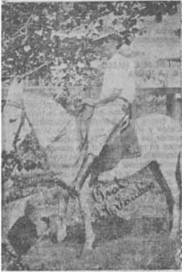
FOTO DE SANDINO ANTES DE LA GUERRA

esta gráfica muestra al Gral. Augusto C. Sandino, jefe principal de la columna revolucionaria del Septentrión, cuando trabajaba en los bananales de una Compañía Frutera en Honduras