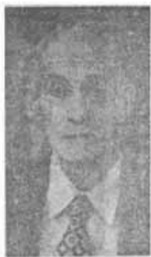
GENERAL CRISANTO ZAPATA, quien organizó con Mario Talavera la Columna del Mombacho.

para siempre al partido por cuyo triunfo gasté luchando tenazmente, toda mi juventud. No se trata de simples resentimientos políticos, ni de disgustos personales de ninguna clase, sino de ideales reivindicados, ideales de mejoramiento y de renovación. Los que juzgan mi actitud de hoy como efecto de mezquinas inconformidades partidistas, se engañan y me hacen el poco favor de creerme incapaz de comprender la necesidad de mi ideal político noble y elevado a la ineficacia y perjuicio de cau-dillo y círculos amorales.