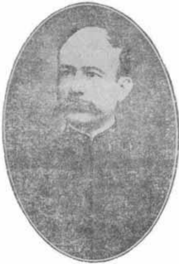
GENERAL JOSE MARIA MONCADA

..creo que los americanos no están con nosotros, por celos del apoyo de México..