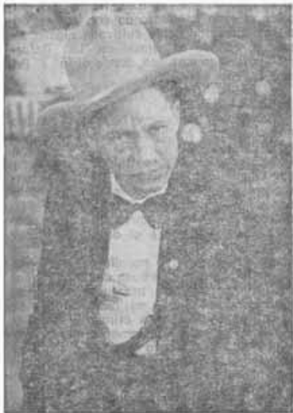
GRAL. AUGUSTO C. SANDINO