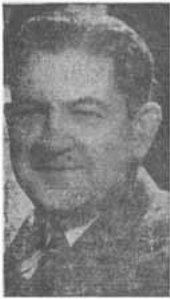
GENERAL CARLOS PASOS LEIVA

nas relaciones con las empresas bananeras y madereras como la United Fruit Company y Bragmann Bluff Lumber Company. A éstas las proveía de los productos de dichas haciendas, así como suplía a los Comisariatos de las mismas con mercaderías que traían sus embarcaciones, entre las cuales figuraban cinco lanchas de mar y cinco de río (San Carlos-El Colorado). Asimismo proveía a la costa de los más variados "refrescos", por compra de una fábrica que hizo a Mister Springer, y fundó varias industrias más.