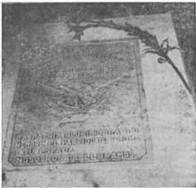
TUMBA DEL GRAL. Y EX-PDTE. MONCADA ...mucho temo no poder llegar a la cuarta ocasión de ocurrir a la defensa de las libertades públicas, pero quisiera, porque el mal echará nuevas raíces. Murió en 1945 y está enterrado en Masatepe, su ciudad natal...

"Las armas y municiones de Puerto Cabezas y Río Grande pueden de igual manera removerse por sus representantes debidamente autorizados, con botes y hombres desarmados.