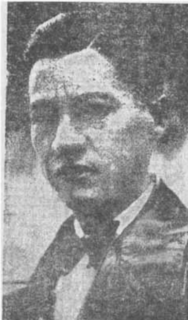
GENERAL AUGUSTO C. SANDINO