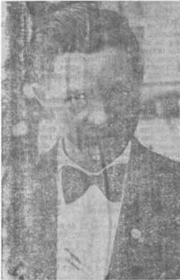
GENERAL AUGUSTO C. SANDINO

(Relato contenido en una extensa carta escrita en El Chipotón el 18 de Marzo de 1929, y otros documentos publicados en libros de su biógrafo argentino, Gregorio Selsler)