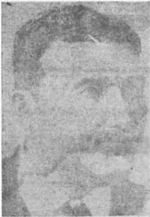
GENERAL LUIS MENA