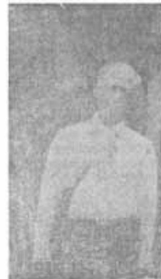
GENERAL JOSE MARIA MONCADA

Juntamente con el grupo de Mr. Stimson se vio descender a los delegados del Dr. Sacasa, los que inmediatamente se dirigieron al hotel a saludar a los representantes del Ejército. Mientras tanto, el comisionado norteamericano fue a refugiarse a la sombra del Espino Negro. Llenos de fe salieron el general Moncada y delegados hacia el Espino Negro. Al verificarse las presentaciones de estilo, inicianse las pláticas que habían de conducir poco a poco a lo que nadie esperaba, a la "Imposición Stimson".