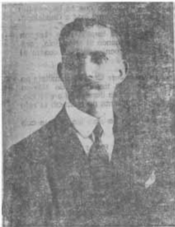
Ex-Presidente Doctor JUAN B. SACASA ..si hubiera venido a tiempo ya no pasaríamos dificultades..

No hicimos nosotros tales honores. No quiso la suerte, para no permitimos ese rasgo de pundonor e hidalguía.