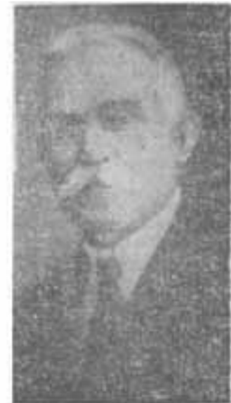
GENERAL PAULINO GODOY