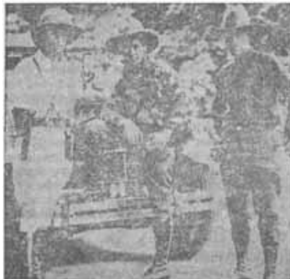
SANDINO Y DOS AYUDANTES CUANDO PASO POR EL SALVADOR HACIA MEXICO.

de guerra de que disponía en la plaza. Se había llegado a sentir terror a nuestra columna. Las mesetas y los cerros de Yacapuca, y Saraguazca estaban sembradas de cadáveres de los combates anteriores. Integramos ahora la columna segoviana ochocientos hombres de caballería muy bien equipados y nuestro pabellón rojo y negro se alzaba majestuoso en aquellas agrestes y frías colinas. Después supe que los 150 hombres que destaqué fueron los que salvaron el tren de guerra de Moncada, que estuvo a punto de caer en poder del enemigo.