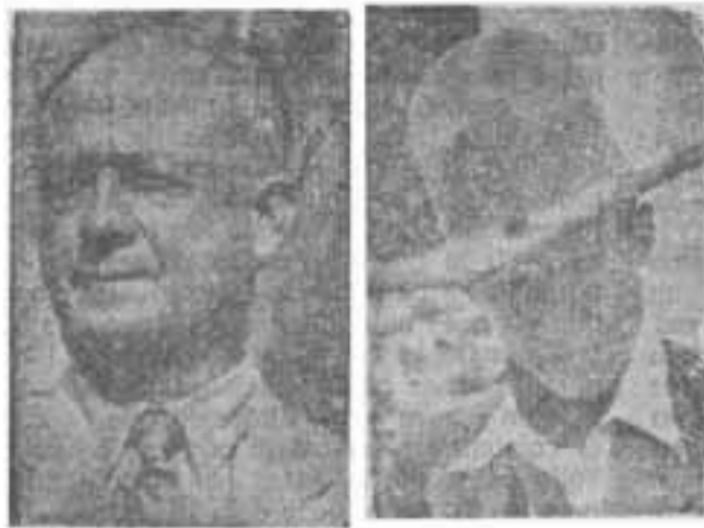
GRAL. MONCADA GRAL. SANDINO

El sitio de Moncada había sido levantado. "Ni un muerto, ni un herido". luego refata el encuentro con Moncada: